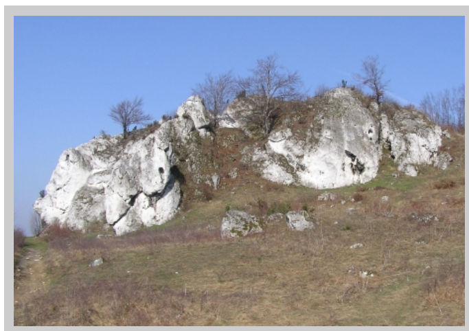
Turnia Kursantów, Narożna i Dziurawa